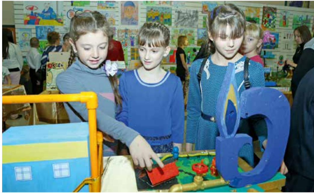
Каждый может проявить свой талант. Главное — не сидеть без дела

25 ноября во Дворце культуры и спорта «Газовик» состоялось награждение победителей детского конкурса литературно-художественного и прикладного творчества «Золотая эпоха Оренбургского газа». Редакция газеты «Оренбургский газ» провела его в тринадцатый раз.