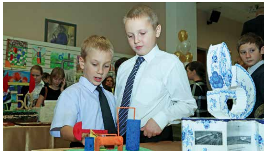
Творческий конкурс учит детей мечтать, создавать, побеждать