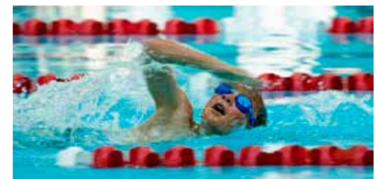
За медалями — в плаву

Восемь команд разных детско-юношеских спортивных школ Оренбурга приняли участие в открытом первенстве по плаванию ДЮСШ «Юбилейный».