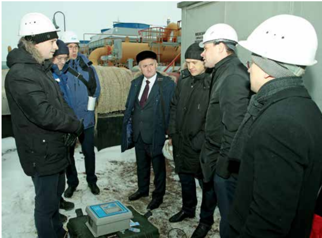
Комиссия изучила параметры работы газоперекачивающего агрегата № 4 ДКС № 2

Коллектив газопромыслового управления приступил ко второму этапу реконструкции дожимной компрессорной станции (ДКС) № 2. Проведенные испытания газотурбинного двигателя и центробежного нагнетателя позволяют получить параметры, необходимые для дальнейшего подбора основного оборудования газоперекачивающих агрегатов.