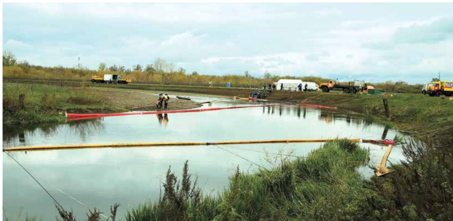
Аварийно-спасательные формирования Общества установили четыре рубежа боновых заграждений

В ходе комплексного учения, которое прошло 19 октября на территории Республики Башкортостан, подтверждена готовность сил и средств ООО «Газпром добыча Оренбург» к локализации и ликвидации аварийных разливов нефти и нефтепродуктов.