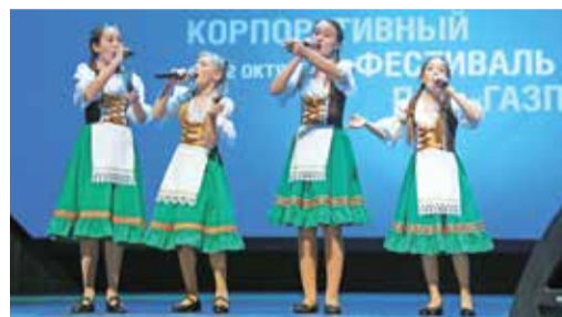
Солисты ансамбля «Классика» поедут в «Артек»

Не случайно именно этим двум мужским коллективам, а также «Альянсу» доверили