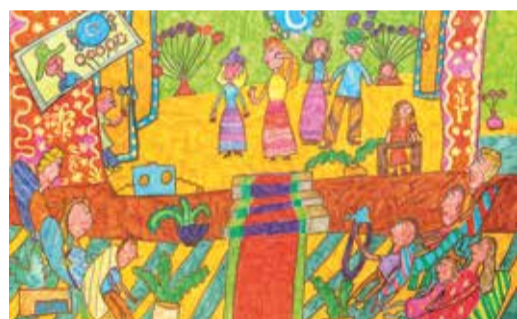
«Концерт для газовиков». Софья НЕВСТРУЕВА, 9 лет, г. Оренбург