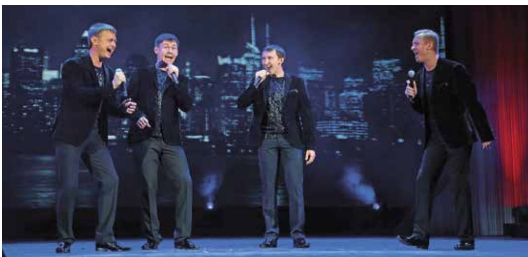
«М-квартет» победно исполнил песню из репертуара Queen