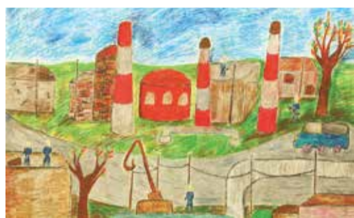
«Рабочие будни». Анастасия САМОХВАЛОВА, 14 лет, г. Оренбург