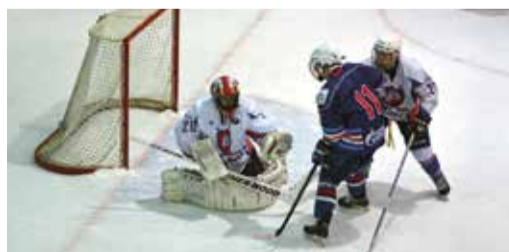
В первом круге за 12 игр наша команда поразила ворота соперников 40 раз

В первом круге первенства по хоккею с шайбой среди юниоров до 18 лет в регионе Поволжье «Юниор Газпром добыча Оренбург» занял 4-е место из 14 команд.