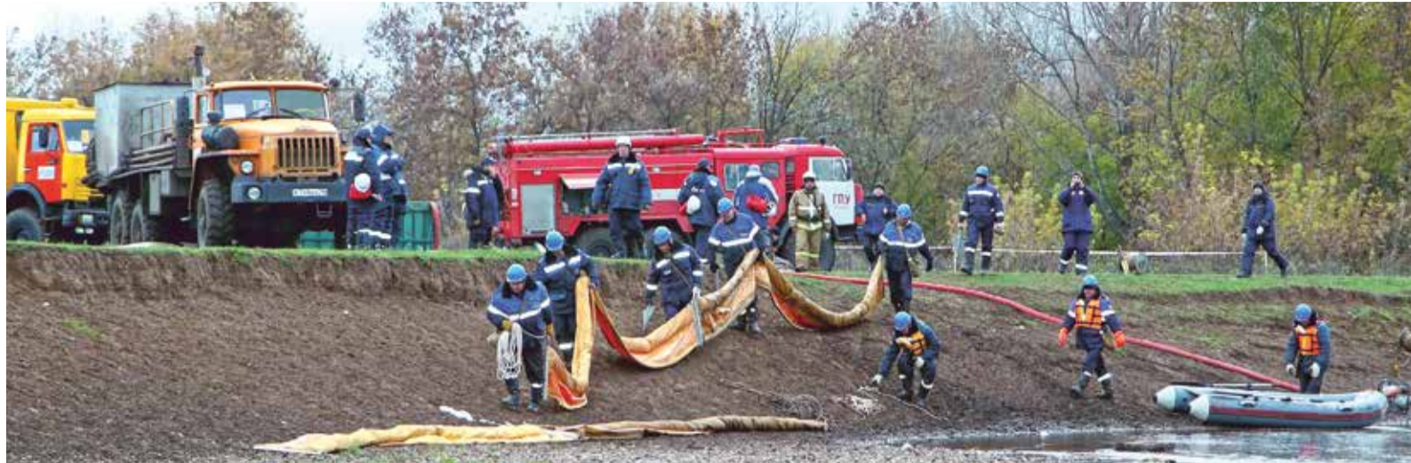
Слаженность действий нештатных аварийно-спасательных формирований Октябрьского ЛПУ — результат многочисленных плановых тренировок

Профессионально отработали свои задачи формирования и расчеты клиники промышленной медицины, ООО «Оренбурггазпожсервис», Башкирского отряда охраны и оренбургские повара ООО «Газпром питание».