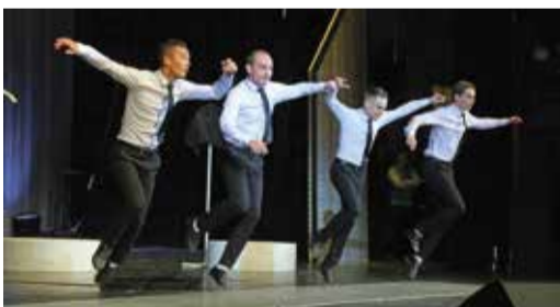
Степистов открыли «Мечта»

Танцевальной группе «Степ-данс» жюри присудило также второе место, но для