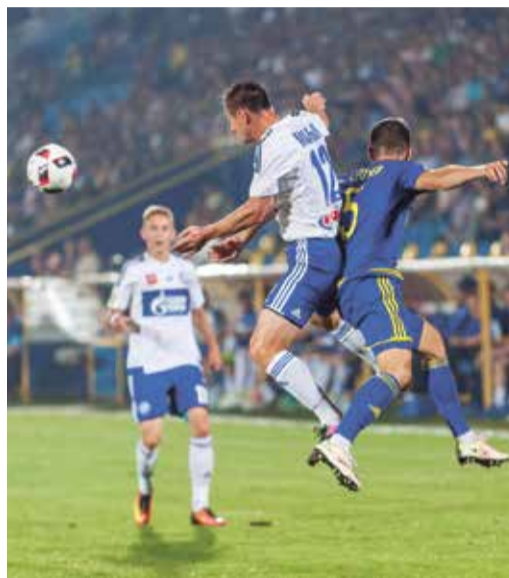
В матче с «Ростовом» ФК «Оренбург» уступил 0:1