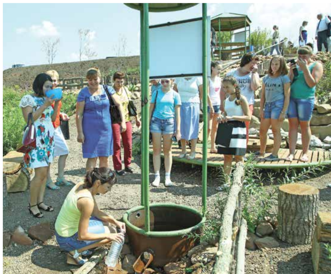
В знойный летний день Полевой напоил всех прохладной водой

Людмила КАЛМЫКОВА