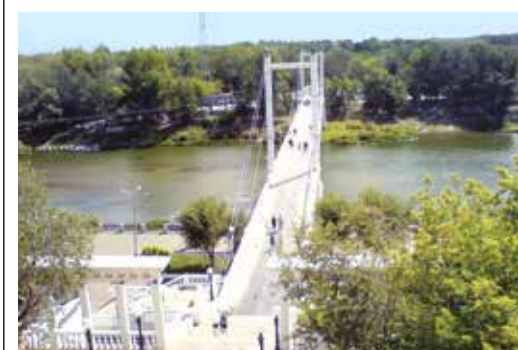
Мост через реку Урал

А самый первый мост на этом месте был построен в 1835 году. В его проектировании и строительстве принимал участие чиновник особых поручений, писатель и собиратель «Толкового словаря живого великорусского языка» Владимир Даль.