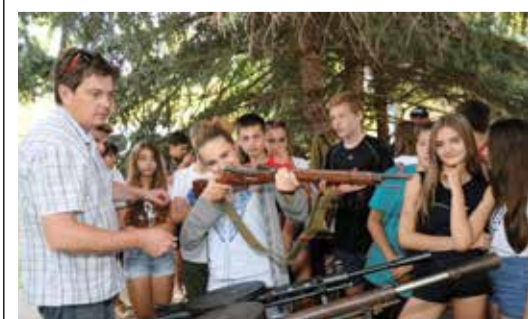
Дети выстраивались в очередь, чтобы поддержать в руках оружие, с которым сражались прадеды

Костяк оренбургского сводного поискового отряда составляют работники ООО «Газпром добыча Оренбург». Предприятие не первый год выделяет финансовую помощь для организации поисковых экспедиций в места наиболее кровопролитных боев Великой Отечественной войны для увековечивания памяти ее героев. Традицией стало проведение оренбургскими газовиками и поисковиками совместных патриотических акций для молодежи.