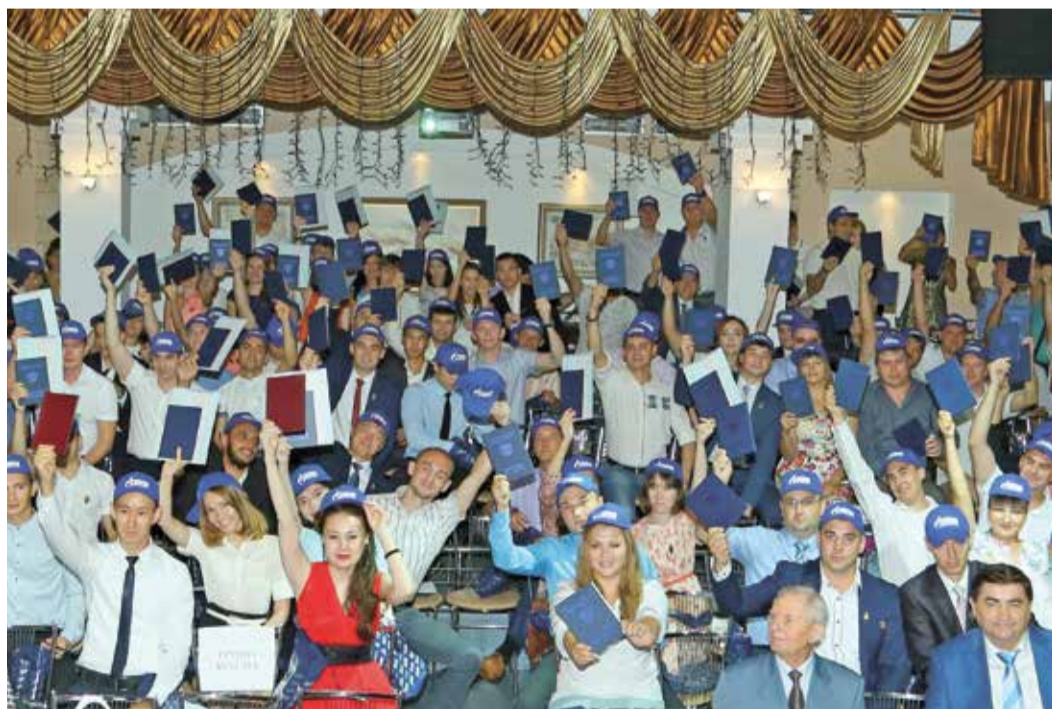
За ними — будущее Оренбургского газового комплекса

29 июля во Дворце культуры и спорта «Газовик» вручены дипломы выпускникам Оренбургского филиала РГУ нефти и газа имени И. М. Губкина. Нынешний выпуск юбилейный — 30-й.