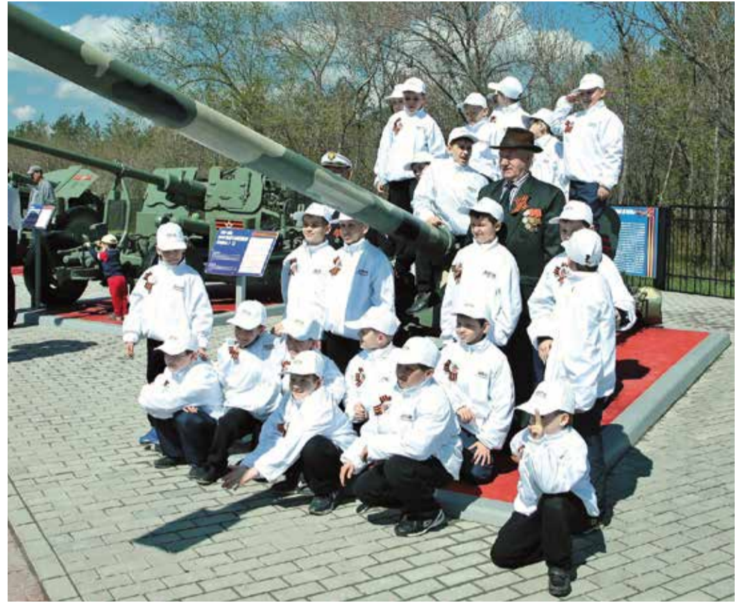
Мощь и слава русского оружия в экспозиции под открытым небом