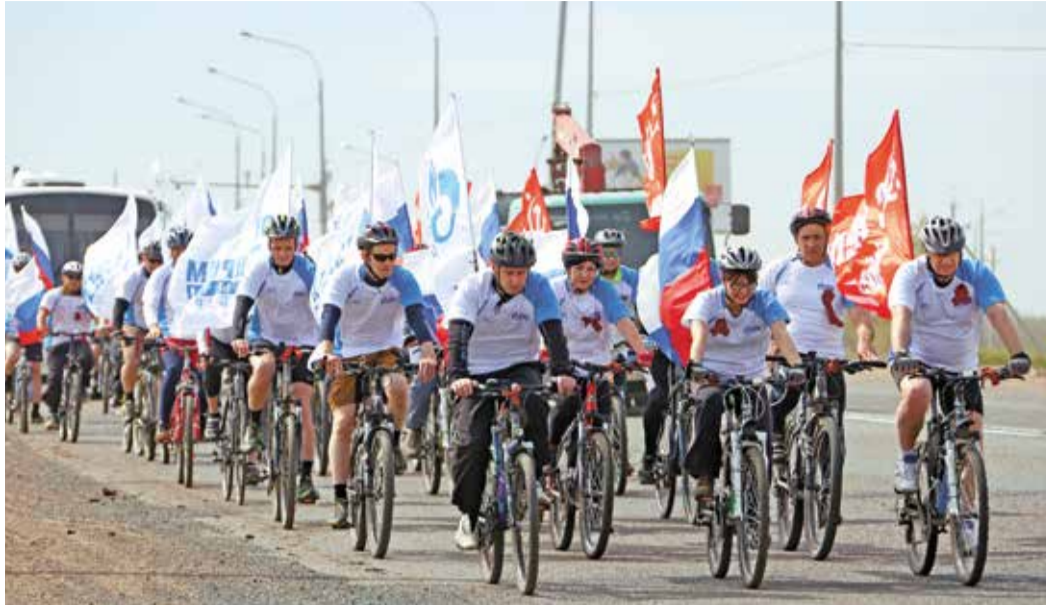
Газовики отметили самый дорогой для страны праздник на самом экологичном виде транспорта

Утром 7 мая зеленый свет был дан участникам велопарада, посвященного 71-й годовщине Великой Победы. Это мероприятие уже стало доброй традицией для работников ООО «Газпром добыча Оренбург».