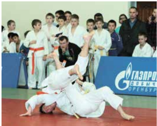
Дзюдо воспитывает в детях сдержанность и целеустремленность