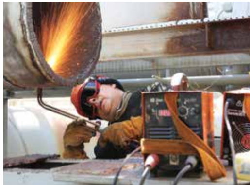
Идет подготовка к монтажу нового крана