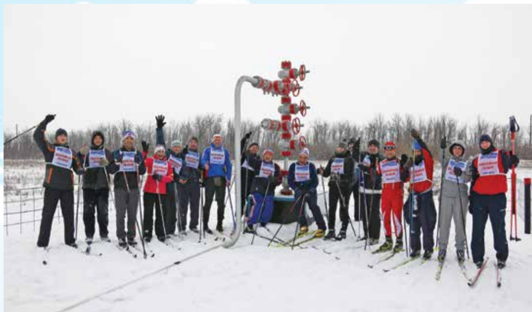
Оренбургские газовики: «Мы — одна команда!»

Взяв старт от установки комплексной подготовки газа № 3 ГПУ, лыжники преодолели порядка 12 километров и финишировали у разведочной скважины № 13.