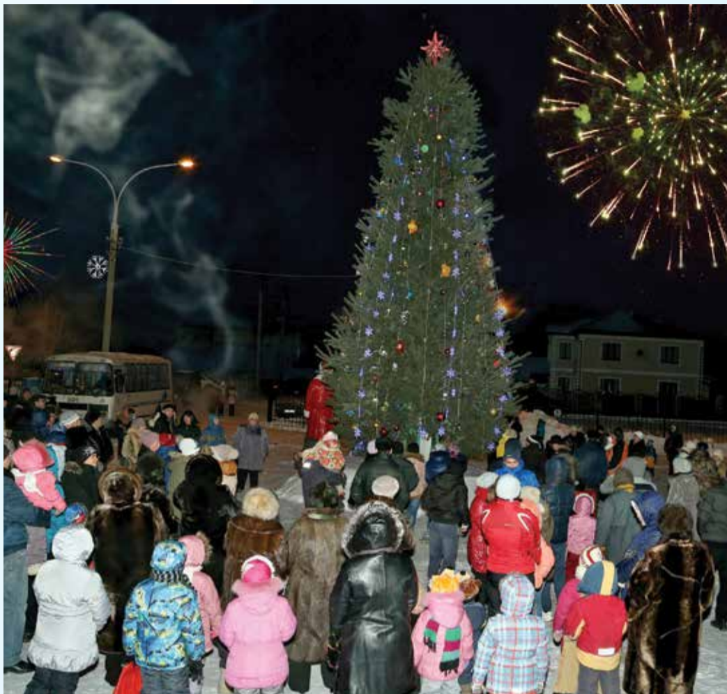
Новому году — салют!

В музыкальном театрализованном представлении с героями «Ночи перед Рождеством» из Диканьки на новый лад добро отпраздновало победу над злом. А благодаря организаторским способностям Деда Мороза и Снегурочки детвора и взрослые дружно закричали, и лесные красавицы засверкали огнями. Стоило только произ-