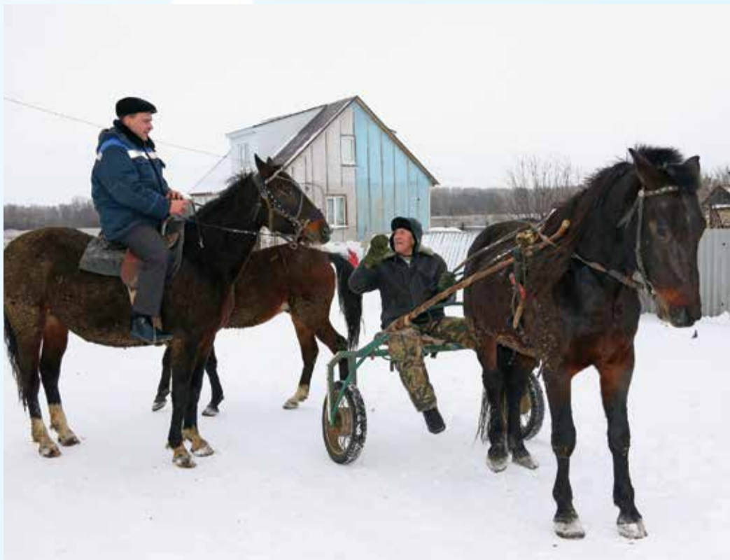
Кони — в помощь и в радость