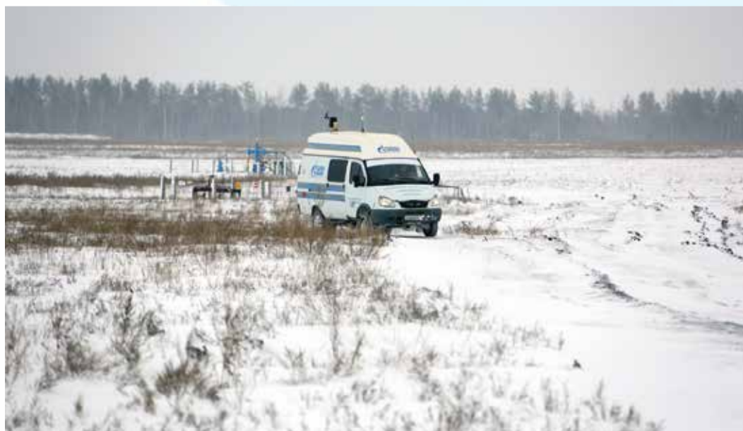
Передвижная лаборатория регистрирует малейшие изменения показателей