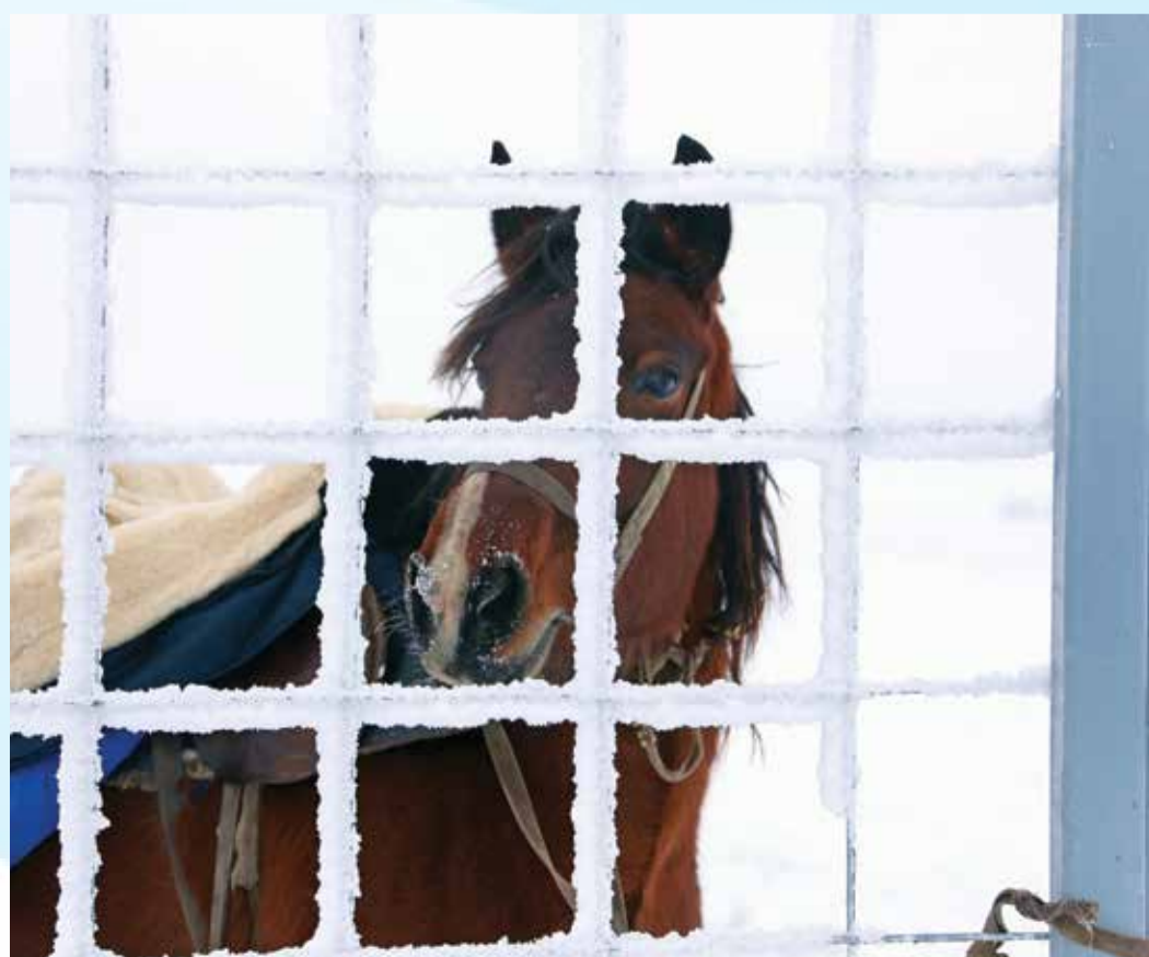
«Проверяй скорее свои задвижки: я тебя жду...»