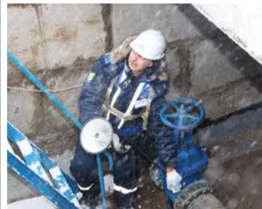
Голос воды услышали все

Светлана БОРИСОВА