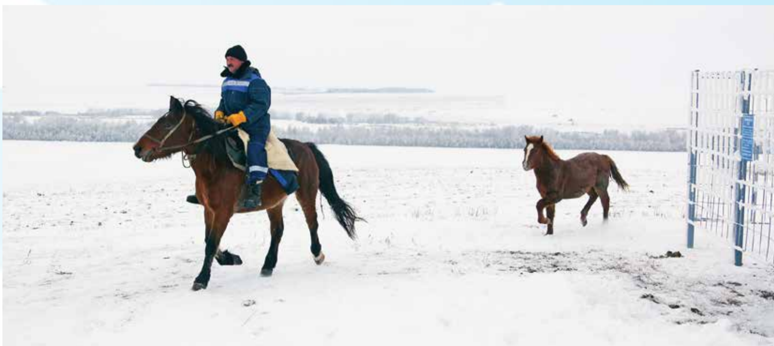
Друзья «не разлей вода»

Трубопроводные трассы ООО «Газпром добыча Оренбург» являются охранной зоной. На всей протяженности, согласно закону, не должно быть посторонних людей и техники. Все проводимые здесь работы