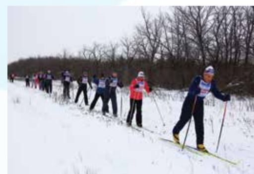
Лыжня в лыжню

Итог «юбилейной лыжни» — сплочение людей. Заряд бодрости и позитива — луч-