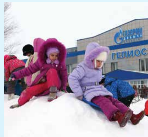
С горки — с ветерком

«Общество «Газпром добыча Оренбург» оформило 8 ледово-елочных городков в Оренбурге и в Оренбургском районе, подготовило несколько ледяных катков. Подарки от предприятия получают 16 тысяч ребятшек — дети работников, вос-