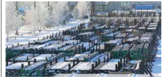
На складах УМТСиК полный порядок

В работе с потребителями управление все вопросы решает быстро и качественно.