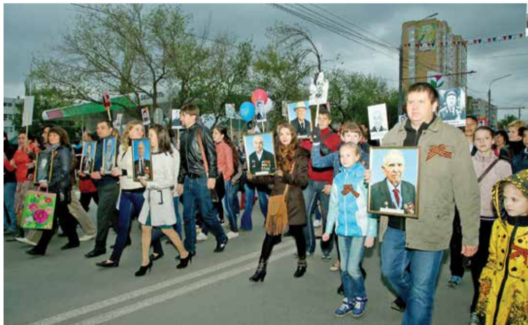
Молодые газовики с портретами коллег-фронтовиков в шествии «Бессмертного полка» 9 мая 2015 года